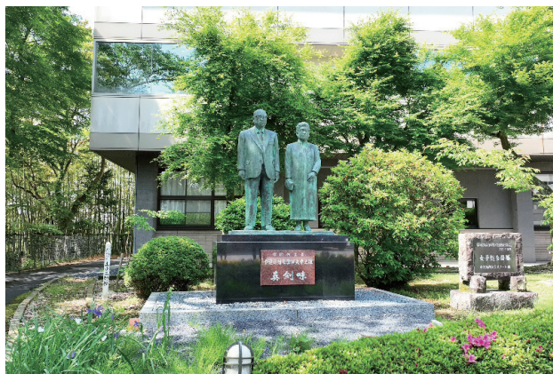
中京学院大学 瑞浪キャンパス

学の精神を突き詰めて考えつつ、これを柱として唯一無二の教育の魅力を高めていくことです。また、少子化の加速と大都市圏への人財流出が後を絶たない地方の中で、地域の若者を育て輩出する地方創生の責務を強く自覚し、私学運営の原点に立ち戻り、建学の精神を具現化する