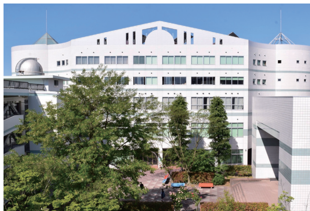
郡山女子大学（創学館全景）

自己点検の委員会活動は、細かい作業も多く、苦勞することもあります。それ以上に今回の訪問調査を通じて、多くのことをご教示いただいたと感じております。評価チームの皆様には深く感謝申し上げます。