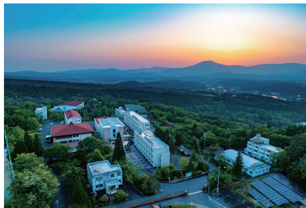
中京学院大学 中津川キャンパス