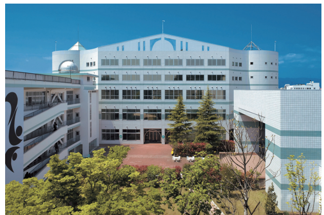
郡山女子大学 キャンパス

私が大学ALOとして、今回の訪問調査、大学認証評価の経験を通じて感じたことは以下の三点です。第一に、学内における自己点検の活動の充実がより一層必要だと感じたことです。委員会を通じて学内の各部署、各委員会間の連携を深め、自己点検活動のPDCAを「実効化」していかなければならないと思っております。第二に、「自己点検・評価報告書」の内容を充実させていくことです。訪問調査において、評価チームの方から「自己点検・評価報告書の正