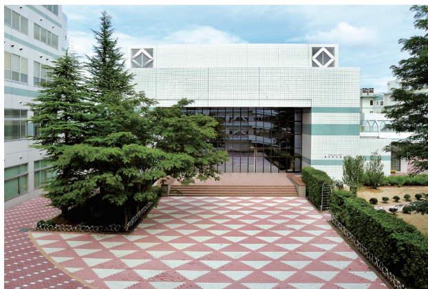
郡山女子大学（建学記念講堂前）

確、誠実な記述が認証評価の基礎」との主旨のお話が心に残りました。本学は毎年「自己点検・評価報告書」を各部署に原稿を依頼し、それを編集して学内外に公表しておりますが、本学が尽力して取り組んでいることは、可能な限り報告書にまとめて学内外にアピールしなければならないと思いました。第三に、日々の教育・研究・地域貢献活動が自己点検に繋がっていると